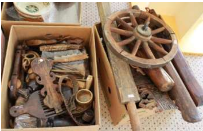
Diverse articole artizanale din donația „Iosif Herța”