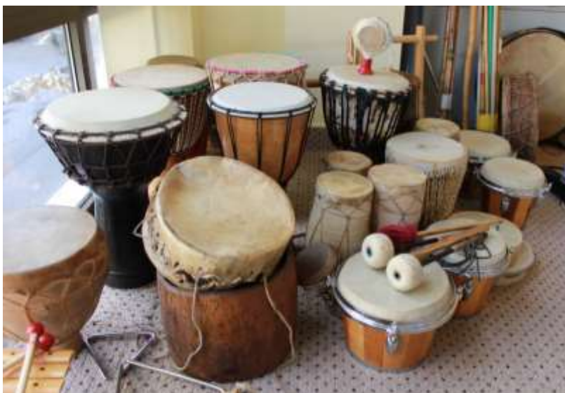
Colecția de tobe din donația „Iosif Herțea”

„Nicolae Bălcescu, una dintre figurile cele mai luminoase ale istoriei românești!” - 205 ani de la nașterea istoricului, revoluționarului pașoptist și scriitorului Nicolae Bălcescu (1819), membru post-mortem al Academiei Române - vitrină de carte realizată la Compartimentul Împrumut carte pentru adulți - 29 iun.