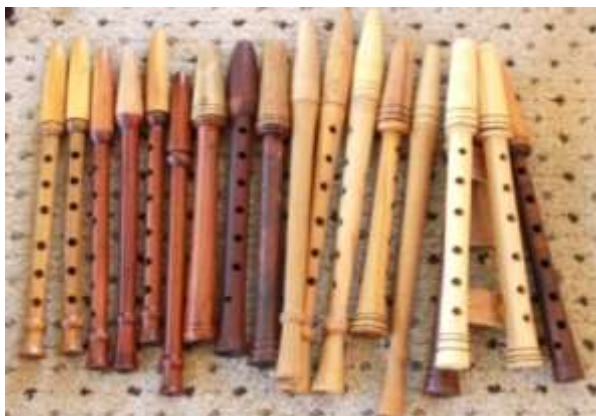
Colecția de fluierie din donația „Iosif Herțea” de la Biblioteca Județeană „Petre Dulfu” Baia Mare

„Gheorghe Șincai, viața, opera și ideile lui” - 150 de ani de la nașterea istoricului și filologului (1754) - vitrină de carte realizată la Compartimentul Împrumut carte pentru adulți - 28 febr.