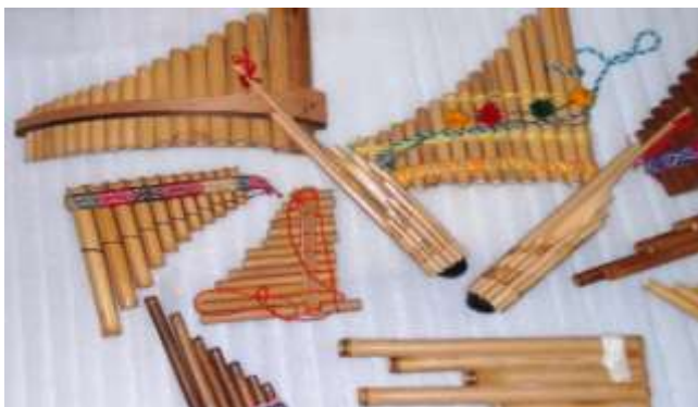
Naiuri din colecția „Iosif Herța” a Bibliotecii Județene

30 apr. - 30 de ani de la moartea actorului George Constantin (1994)