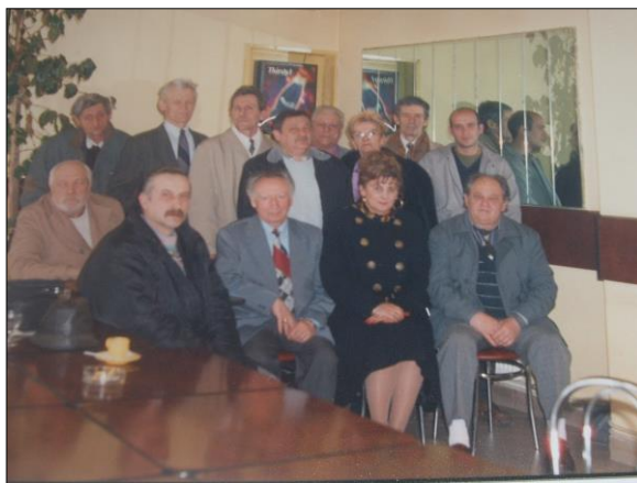
Cu membrii Cenaclului Scriitorilor Baia Mare